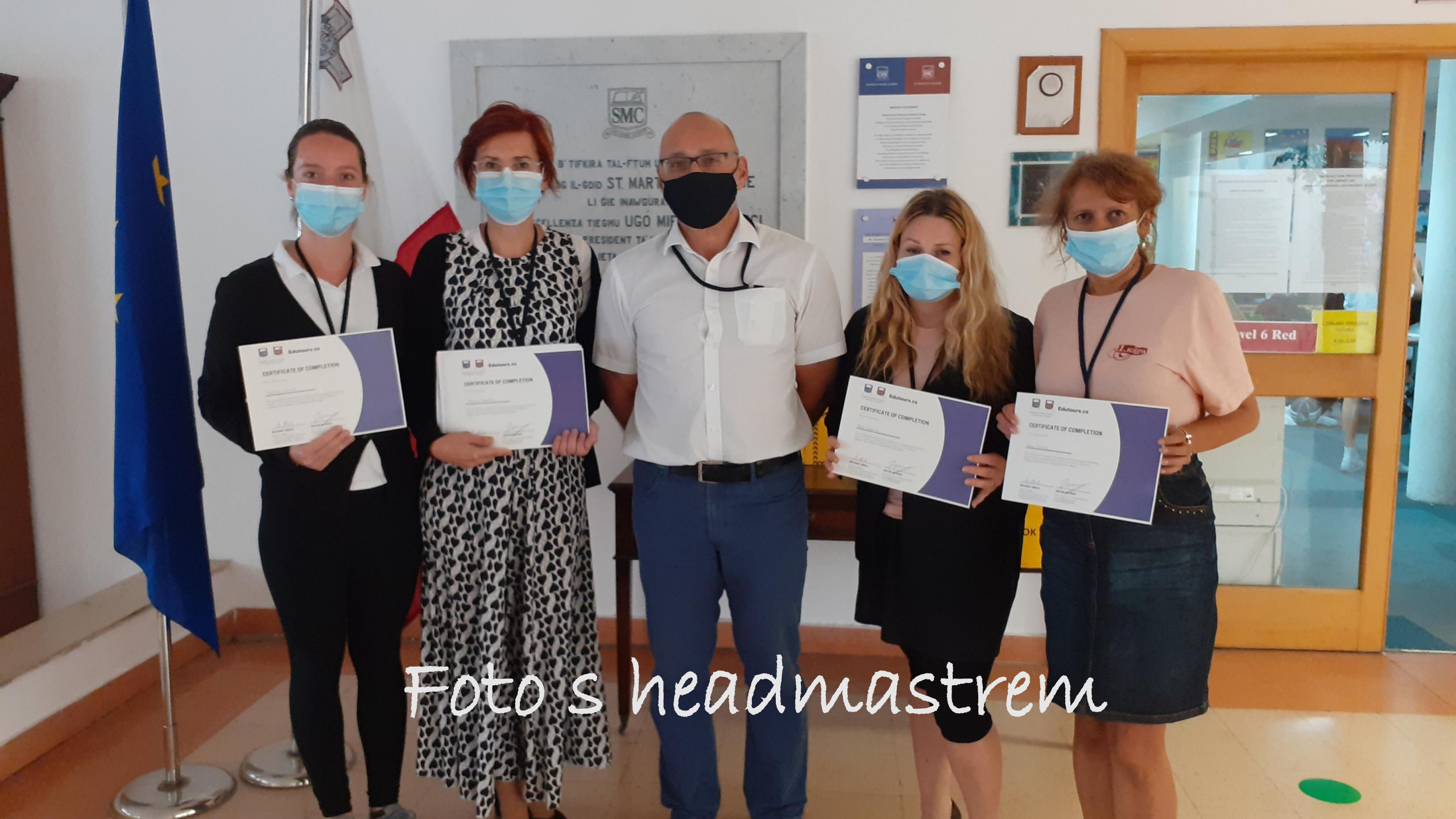
Foto s headmastrem